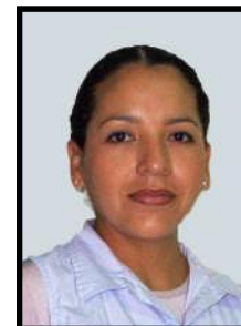
Virginia Ruíz de De Lira Estudios Pedagógicos